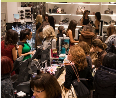
Imagen de uno de los comercios participantes

Las calles fueron escenario de música en directo, desfiles, photocalls, degustaciones, sorteos, regalos y por supuesto interesantes descuentos y promociones. Todas estas actividades junto a las ofertas hicieron que el público participara de forma muy activa y visitara y efectuara sus compras en los respectivos comercios. Así, se estima que el beneficio económico ha sido de más de 1 millón de euros en ventas en tan sólo 4 horas .