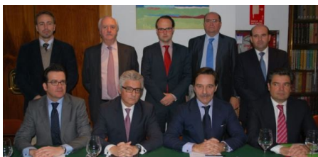
Representantes de Cooperativas Agroalimentarias, ANGED, FEHRCAREM, CEC, ACES, ASEDAS, AECOC, FIAB y FEHR

La destrucción de 174.000 empleos y una caída de la recaudación que podría llegar a los 4.000 millones de euros. Son algunas de las conclusiones del Informe Económico encargado por las Organizaciones y que fue presentado esta semana. "La última subida del IVA provocó una caída media del consumo del 7%, otro incremento sería letal para nuestros sectores, que representan más del 20% del PIB", alertaron en rueda de prensa.